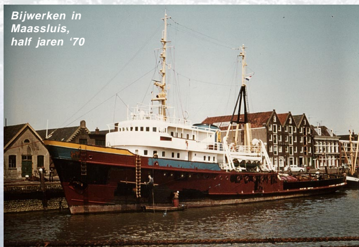
Bijwerken in Maassluis, half jaren '70