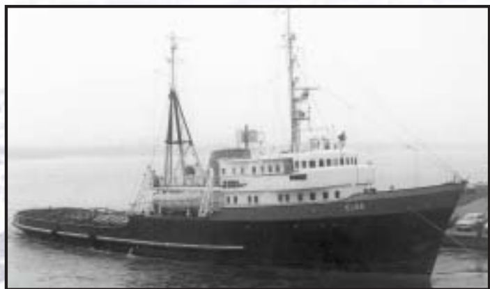
Laatste vertrek uit Maassluis in 1976, op weg naar de Verolme werf te Cork voor ombouw tot loodsboot.

maatschappij en seinvlaggen. Verder is het traject met de divisie Scheepvaart van Inspectie Verkeer & Waterstaat (v/h Scheepvaartinspectie) ingezet met als einddoel het schip weer volledig gecertificeerd onder klasse te krijgen.